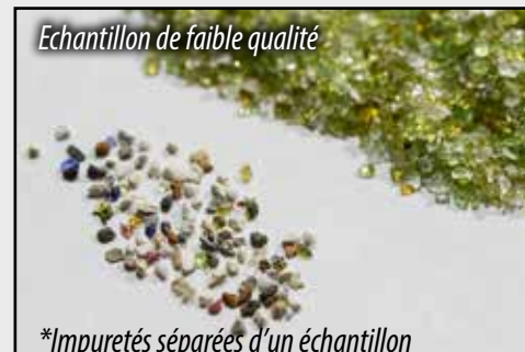
Nature Works Glass Filter Media

100% pur et blanc - exempt d'impuretés inconnus